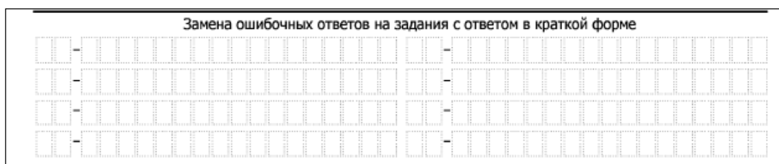
Рис.3. Область замены ошибочных ответов на задания с кратким ответом

В случае, если КИМ не предусматривает записи ответа на бланке №1, поле для записи ответа заполнено символами «XXX».