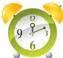
звук часового механизма