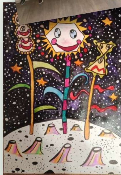
Выставка от 1 Д класса