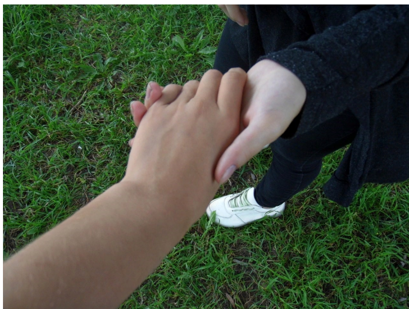
Очерк составила : Токмакова Ксения

По всему миру существует огромное количество людей остающимися равнодушными ко всему происходящему. Каждый из них, вероятно считает, что его это не коснется...это одно из самых глупых убеждений, в которое только может верить человек. Конечно, в противовес всем равнодушным, встают волонтеры.