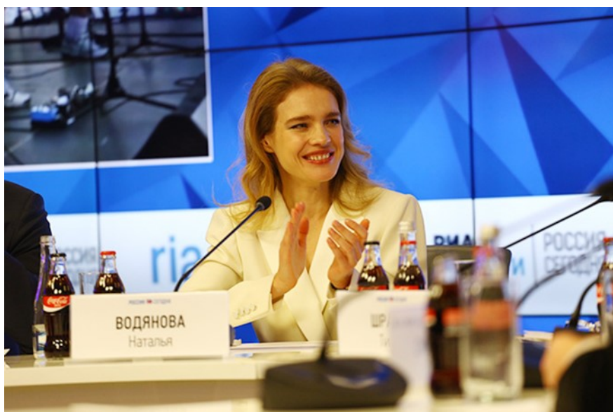
Очерк составила : Червенко Ангелина

Фонд оказывает адресную помощь. Наталья уверена, что таким образом эффективнее все-